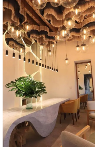
SAN MIGUEL DE ALLENDE – 1 NOCHE HOTEL BOUTIQUE LA CONCEPCIÓN