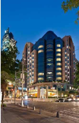
CIUDAD DE MÉXICO – 3 NOCHES HOTEL MARQUIS REFORMA

En La Vuelta, nos dedicamos a los detalles y a una planificación cuidadosa para asegurar que cada aspecto de tu experiencia sea excepcional. Hemos seleccionado cuidadosamente hoteles boutique y con carácter que ofrecen autenticidad y un ambiente acogedor, brindándote una estadía que complementa a la perfección la esencia de México. Queremos que cada momento de este viaje esté a la altura de lo que descubrirás.