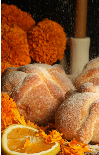
PAN DE MUERTOS

En La Vuelta, creemos que la gastronomía es una puerta hacia el corazón de cada cultura y sobre todo si hablamos de México, donde su comida incluso fue declarada Patrimonio Cultural Inmaterial de la Humanidad. Hemos seleccionado experiencias culinarias que te permitirán explorar lo mejor de la cocina de cada estado, ciudad y pueblo que visitemos.