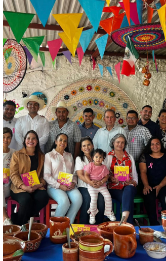
“MUJERES DEL VALLE”