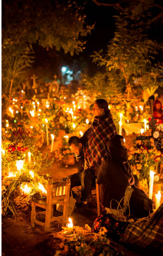
NOCHE EN CEMENTERIO

Creemos que estas experiencias son la esencia de La Vuelta: momentos que no estaban en el itinerario, pero que se graban en la memoria y en el corazón. Nos dedicamos a los detalles para que cada paso por México esté lleno de magia, emoción y descubrimientos inesperados.