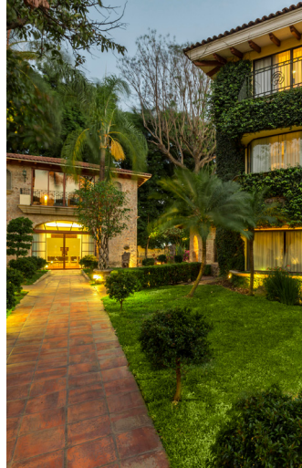
GUADALAJARA – 2 NOCHES HOTEL QUINTA REAL