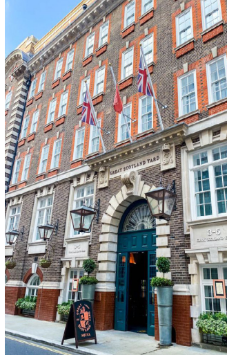
HOTEL GREAT SCOTLAND YARD - 3 NOCHES LONDRES ★★★★★