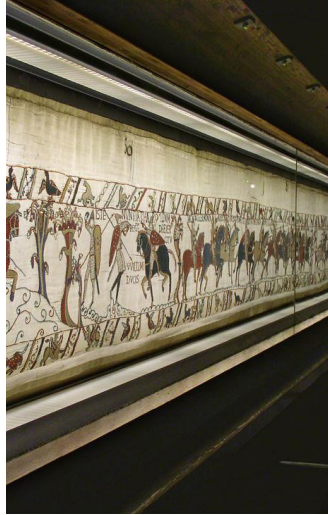
TAPIZ DE BAYEUX