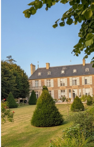
HOTEL DOMAINE DE BAYEUX 3 NOCHES BAYEUX ★★★★★

En La Vuelta nos enfocamos en los detalles y en una planificación cuidadosa para asegurar que cada aspecto del viaje sea excepcional. Hemos seleccionado hoteles que reflejan la autenticidad, el carácter y la calidez de las ciudades imperiales, brindándonos estadias que complementan a la perfección la esencia de Francia, Inglaterra e Italia, y el legado cultural e histórico de cada lugar.