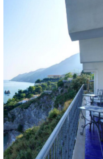
HOTEL LLOYD'S BAIA - 2 NOCHES COSTA AMALFITANA ★★★★★