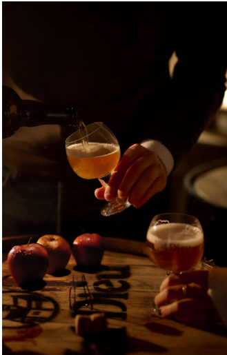
CATA DE CALVADOS Y CIDRA

Cada una de estas experiencias ha sido pensada para revelar una dimensión distinta del viaje, generando momentos que permanecen mucho más allá del recorrido.