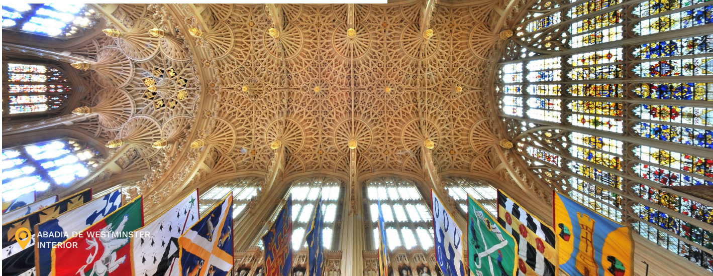
ABADIA DE WESTMINSTER INTERIOR