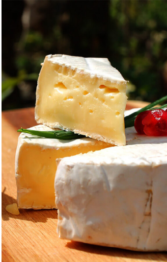
QUESOS EN NORMANDÍA

En La Vuelta, creemos que la gastronomía es una puerta hacia el corazón de cada cultura. Frescos ingredientes locales, cada bocado y cada copa cuentan una historia única. Hemos seleccionado experiencias culinarias y degustaciones que te permitirán conectar con el destino de otra manera.